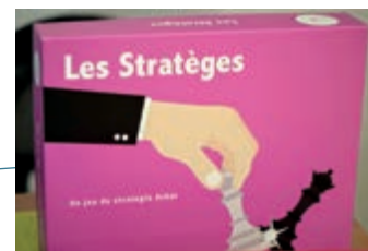
Les Stratèges : un jeu pédagogique CDAF Formation